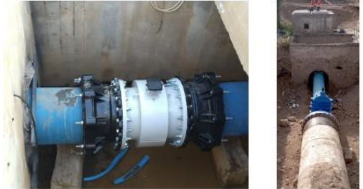
Changement de vannes d'une pompe de reprise à Comps